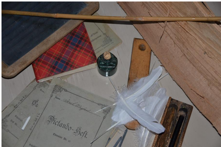
Leihgaben vom Tabor Feldbach und von privater Sammlung

Vom Rohrstaberl, Scheitelknien... Früher waren Rohrstaberl, Scheitelknien oder Winklerstehen mancherorts beliebte Disziplinierungsmaßnahmen und es galt eine strenge Schulordnung einzuhalten. Heute gibt es schulparterschaftliche Verhaltensvereinbarungen und selbstverständlich sind körperliche Strafen längst aus den Klassenzimmern verschwunden. Der respektvolle und wertschätzende Umgang haben aber auch heute noch einen großen Stellenwert.